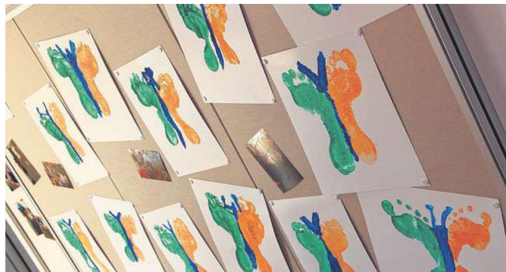
Auch Bewohner des Seniorenheimes beteiligten sich mit Schmetterlingen aus Fußabdrücken an der Aktion.