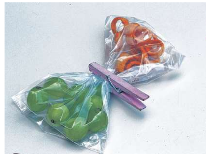
Auch aus Obst und Knabberien machten Kinder Schmetterlinge.