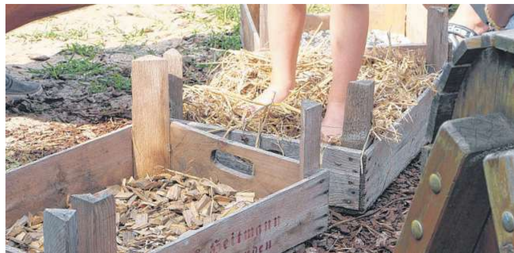
In einem Barfußpfad galt es verschiedene Untergründe zu erfühlen.