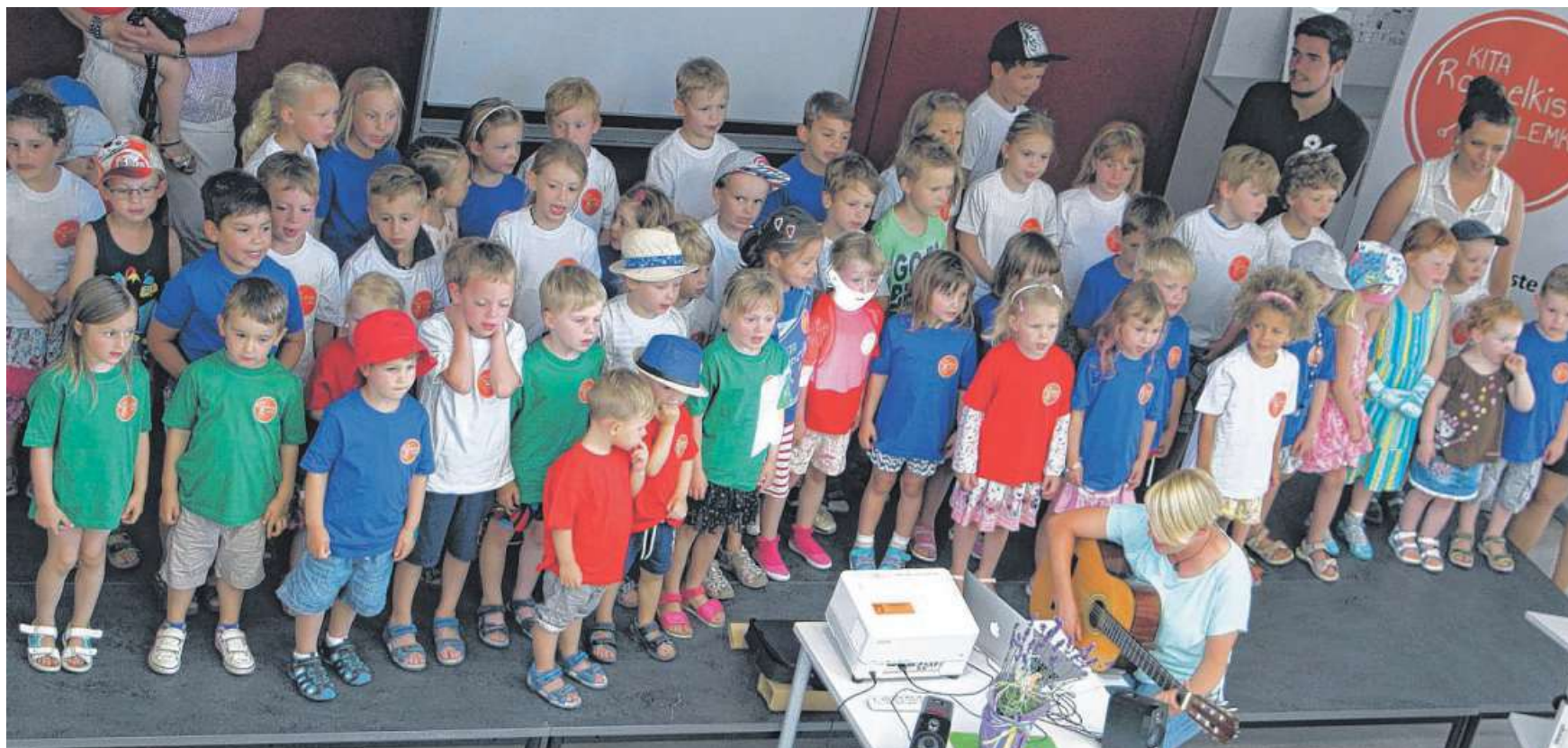
Die Kinder aus der Rappelkiste präsentierten nicht nur Lieder, sondern auch neue T-Shirts und ihren eigenen kleinen Film.

Der Film, den die Kinder zur Kampagne gedreht haben, ist auf der Homepage der Einrichtung zu sehen unter www.kita-lemke.de/projekt-schmetterling .